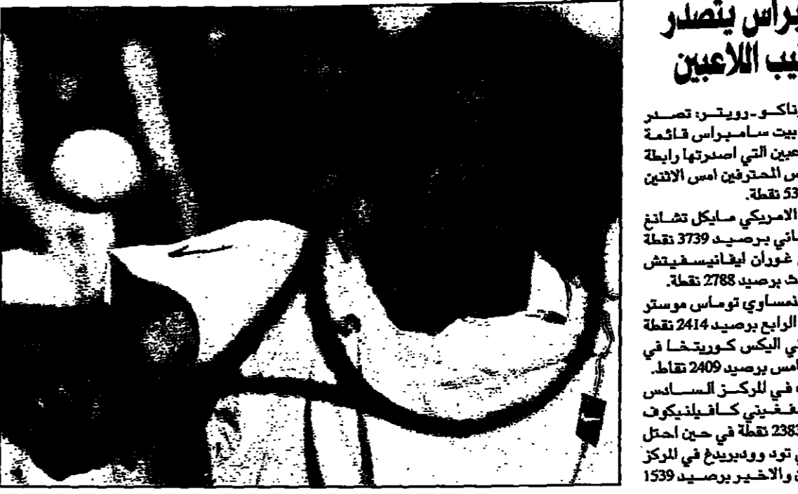
مونيكا سيليش تتسلم اللقب الثالث على التوالي في بطولة نيو هافن.

تورونتو (عندما) - في بطولة كندا الدولية لكرة المضرب التي أقيمت في تورونتو، حصدت مونيكا سيليش اللقب الثالث على التوالي في بطولة نيو هافن، وهي البطولة الثانية من سلسلة بطولات نيو هافن التي تقام في تورونتو. سيليش هي لاعبة أمريكية من أصل بولندي، وهي لاعبة محترفة في كرة المضرب. وكانت سيليش هي صاحبة اللقب في عامي 1995 و1996، وهي الآن في دورتها الثالثة على التوالي في هذه البطولة. سيليش هي لاعبة محترفة في كرة المضرب، وهي لاعبة محترفة في كرة المضرب، وهي لاعبة محترفة في كرة المضرب. وكانت سيليش هي صاحبة اللقب في عامي 1995 و1996، وهي الآن في دورتها الثالثة على التوالي في هذه البطولة. سيليش هي لاعبة محترفة في كرة المضرب، وهي لاعبة محترفة في كرة المضرب، وهي لاعبة محترفة في كرة المضرب.